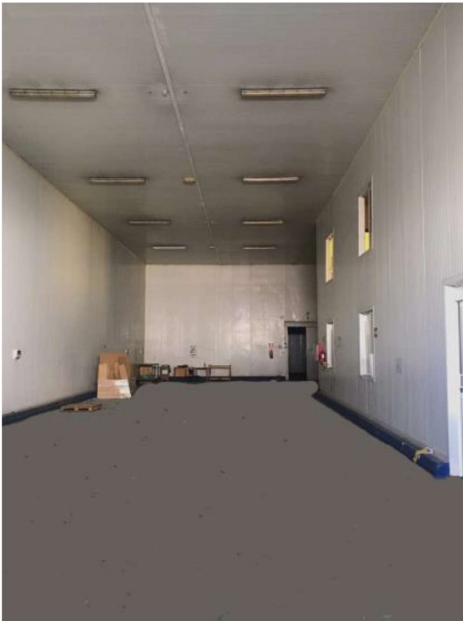
Acceso al interior.