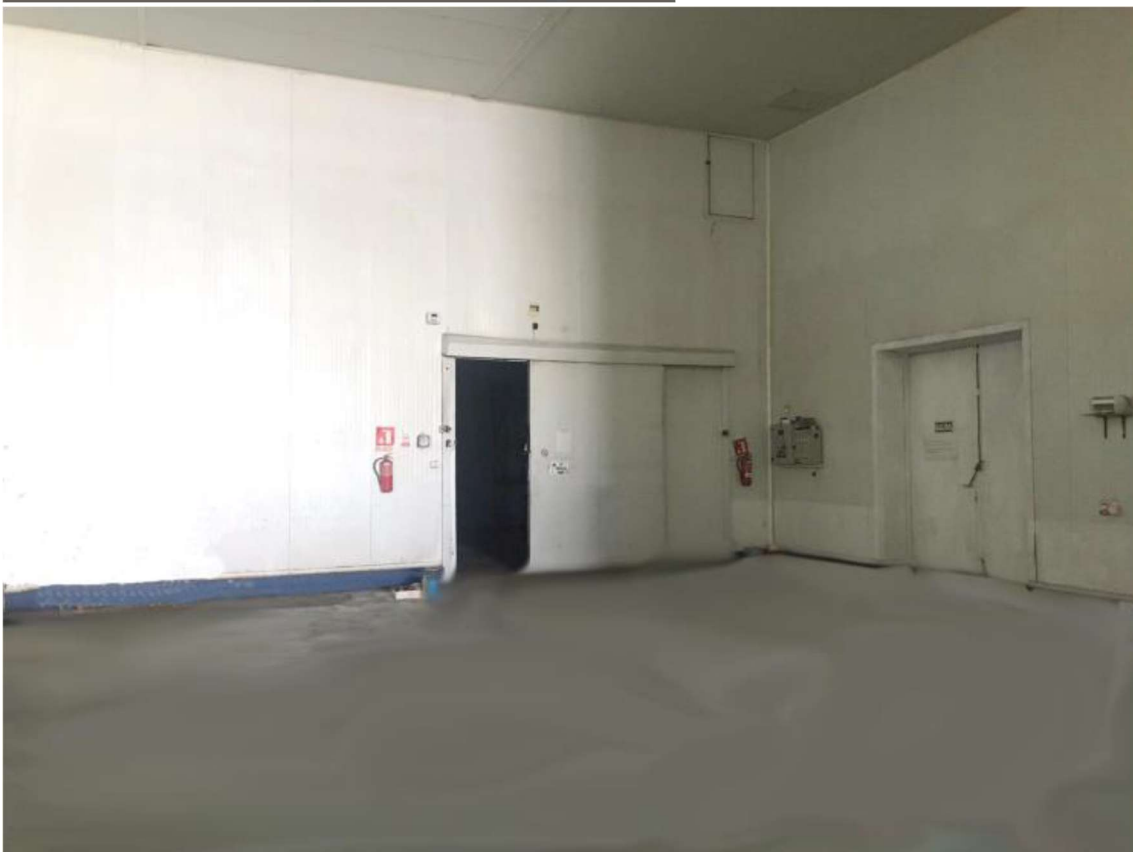
Acceso cámara de refrigeración y salida de emergencia.