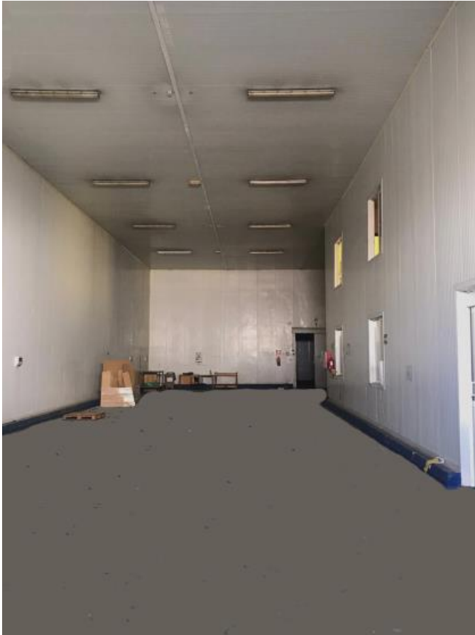
Acceso al interior.