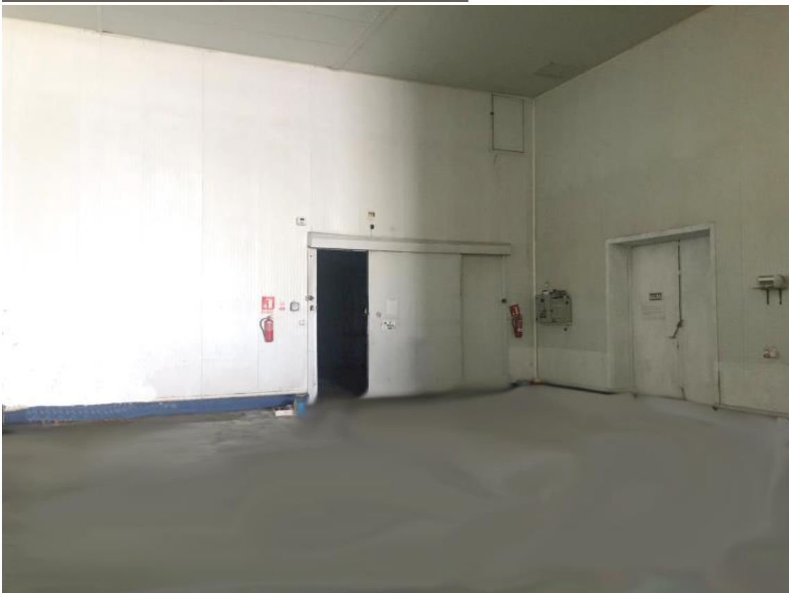
Vista acceso cámara de refrigeración y salida de emergencia.